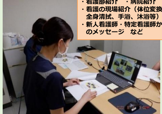
茨城県内の高校生60名（全3回）