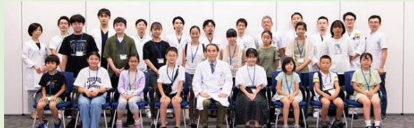
小学校4年生～中学3年生と保護者15組30名（応募者674名）