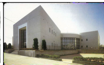
現在の看護専門学校