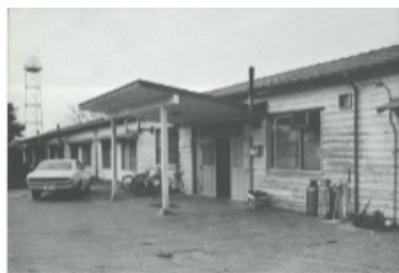
昭和50（1975）年 高等看護学校

その後、学校教育法の改正に伴い専修学校に移行し、昭和53（1978）年、東京医科大学霞ヶ浦看護専門学校となり、夜間部を昼間定時制に変更しました。昭和60（1985）年に現校舎が竣工し、昭和63（1988）年には3年課程に変更されました。設立当初の入学定員は40名でしたが、平成20（2008）年度より70名に増員し、本学の3つの附属病院をはじめ地域で看護師、保健師、助産師として活躍しています。