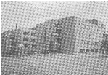
昭和62（1987）年12月 健診センター棟（右）、南病棟（左）

その後、昭和52（1977）年 南病棟（臓器別病棟）、昭和56（1981）年 中央病棟、昭和62（1987）年 健診センター一棟、平成元（1989）年 外来本館棟、平成9（1997）年 東館病棟、平成14（2002）年 医療・福祉研究センターが完成するなど拡大していきました。