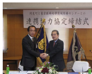
平成26（2014）年 阿見町との協定締結式

平成19（2007）年 地域がん診療連携拠点病院、平成20（2008）年 肝疾患診療連携拠点病院、令和元（2019）年 地域医療支援病院の承認を受け、病床数501床、職員数980名で運営されています（令和3（2021）年4月1日現在）。