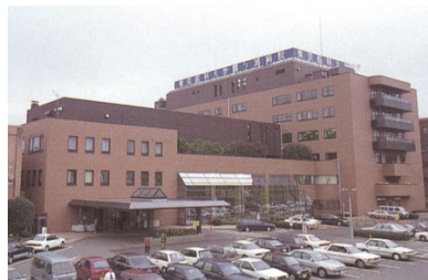
平成9（1997）年12月 外来本館棟（左）、東館病棟（右）