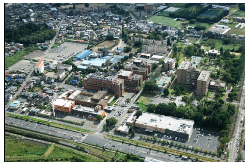
現在の茨城医療センター（東京ドーム2個分の広さを誇る）