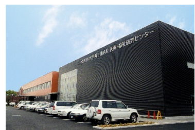
平成14（2002）年1月 医療・福祉研究センター