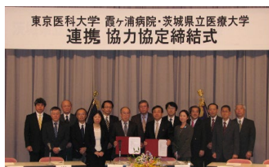
平成21（2009）年 茨城県立医療大学との協定締結式

また、地域にある大学病院としての存在価値を発揮するために、社会連携を積極的に推進し、平成19（2007）年に茨城大学農学部と、平成21（2009）年には茨城県立医療大学と連携協力協定を締結して研究協力を進めています。平成26（2014）年には地元阿見町と連携協力協定を締結して、健康づくり推進や多くの事業で町の発展のために貢献しています。